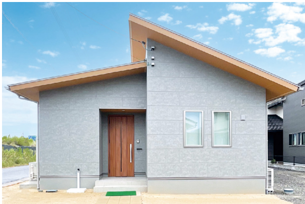
グレー×ナチュラルカラーで表現したシンプルモダンスタイル

「人生にやさしく寄り添ってくれる家」をテーマにした平屋の企画住宅。 心地よい光と風・無駄なく十分な広さ・暮らしの質を高める工夫、3つのこだわり を実現したモデルハウスが完成しました。