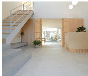
明るく開放感のあるエントランスホール