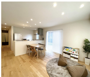
どこにいても家族の気配を感じられる 居心地の良いLDK