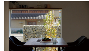
窓辺が印象的なダイニングスペース