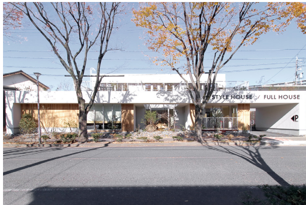
水平ラインが美しいスタイリッシュな外観デザイン

自社の家づくりのコンセプト「地球品質」を体現したスタジオ（管理棟）。 上質な落ち着きを感じる1階、明るい日差しと緑に溢れる2階。それぞれ異なる デザインコンセプトにより創造された空間は、非日常を体験できる場所となっ ています。