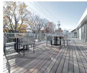
日差しと緑に囲まれるルーフガーデン