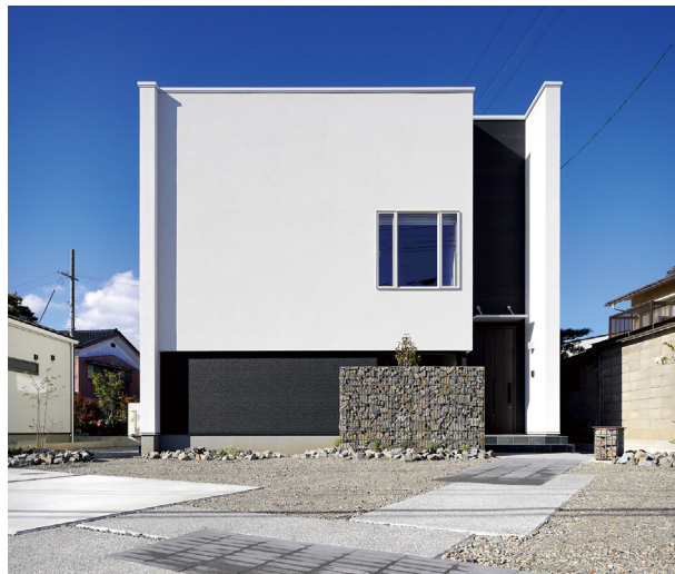
サイドウォールが表情豊かな陰影をもたらすスタイリッシュな外観デザイン

洗練されたフォルムが美しい外観や、白を基調としたシンプルで伸びやかな室内空間。視覚的なものだけでなく「使い勝手や住まいやすさ」など、居心地の良さもデザインのひとつとして計画したモデルハウスです。