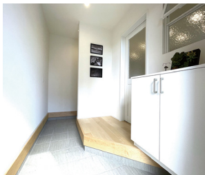
明るく清潔感のある玄関ホール